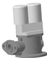
Клапан 734.05.00.00-02 Клапан 734.05.00.00-07