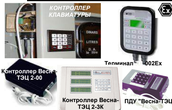
Контроллер Весна-ТЭЦ 2-00